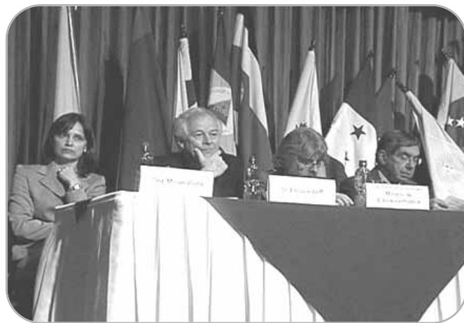
Inauguración del Encuentro, mesa principal.