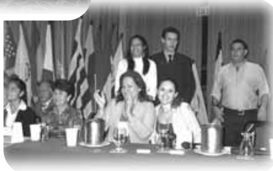
Equipo de Trabajo.