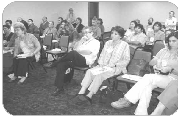
Grupo de Educación no Formal.