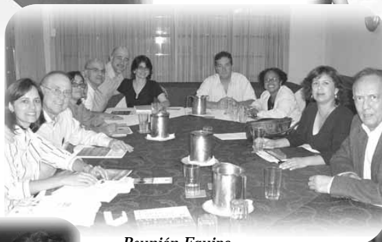
Reunión Equipo Redactor.