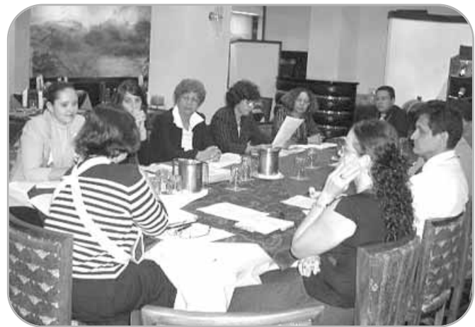
Reunión de Viceministros de Educación.