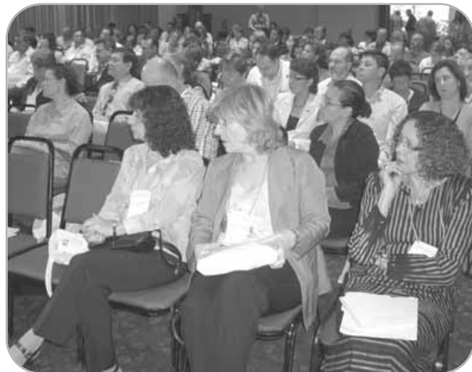
Participantes del Encuentro.