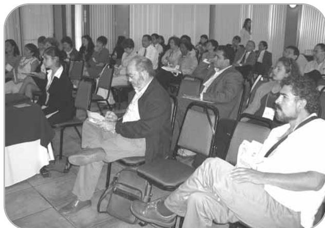
Participantes del Grupo de Educación Primaria.