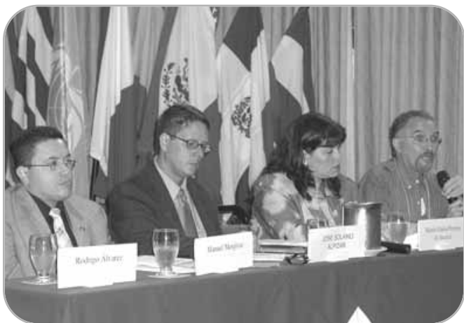
Expositores del Panel 3.