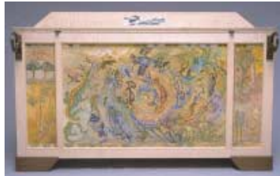
El Arca de la Esperanza

Finalizamos el evento con la lectura de la última oración de la Carta de la