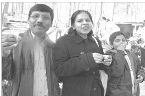
Residentes multiculturales en una celebración en Toronto

personal como instrumento valioso para comprender la sostenibilidad y asuntos éticos y retos relacionados para recomendar el aval del documento por parte de la Junta. Segundo, los resultados se usaron para preparar el plan estratégico de la organización para los próximos años. Tercero, estableció los cimientos para una evaluación y aplicación más cercana de los principios de la Carta de la Tierra dentro de los programas clave de la TRCA (y sus departamentos), tal como la Educación Medio-ambiental. Finalmente permitió al personal de la TRCA presentar y promover La Carta de la Tierra a otros en su jurisdicción.