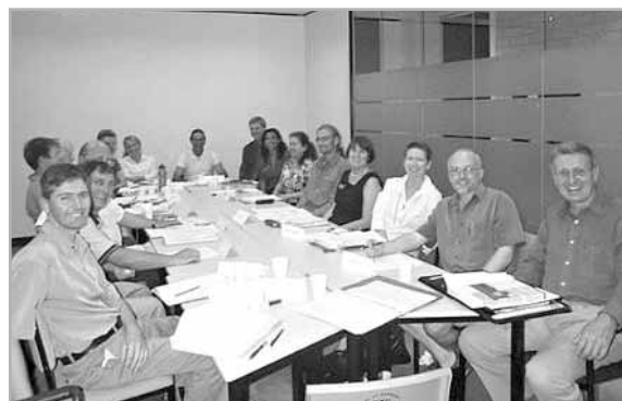
Consejo asesor de sostenibilidad

Los participantes del proyecto fueron el personal de la Unidad de Planificación Estratégica Corporativa y de Negocios del Ayuntamiento con aportación directa de la comunidad y de los principales participantes dentro del Ayuntamiento.