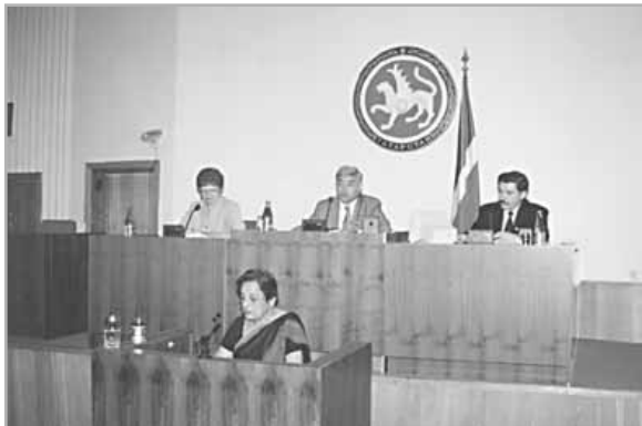
La Comisionada de la Carta de la Tierra Kamla Chowdhry (India) en el parlamento.

Durante el lanzamiento de la Carta de la Tierra en junio de 2000 en Holanda, una representación de Tatarstán anunció la preparación de la República para poner en marcha la Carta de la Tierra en su región. Se estableció un grupo compuesto de organizaciones científicas y públicas, además de parlamentarios, para desarrollar maneras de