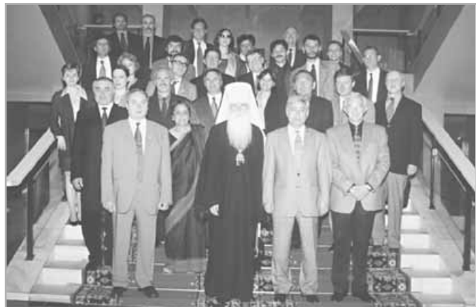
Participantes locales e internacionales de la reunión de la Carta de la Tierra en el Parlamento, abril 2001