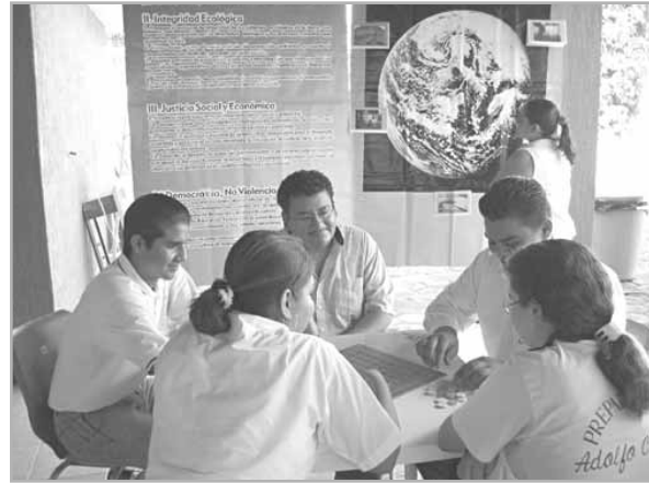
Reunión de la Carta de la Tierra en Apatzigan, México

Para responder a las necesidades de los gobiernos locales, se ha diseñado un proyecto llamado “Modelo del Par Coherente – Agenda 21 y La Carta de la Tierra”, y se está llevando a cabo en el estado de Michoacán. Usa la Agenda 21 como plan de acción y La Carta de la Tierra como herramienta inspiradora para motivar y elevar la conciencia y el compromiso de los ciudadanos y