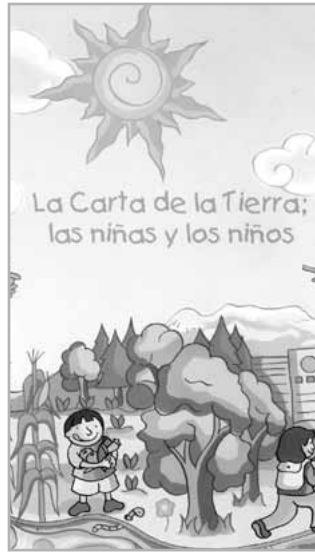
Adaptación para niños

participantes. Además se hicieron 43 seminarios con más de 4.000 participantes. Más de 75.000 folletos de información general, 40.000 adaptaciones para jóvenes y 10.000 para niños se produjeron localmente con el apoyo financiero de SEMARNAT. Dieciséis municipios, 23 instituciones educativas, tres instituciones privadas y más de 4.000 personas han avalado la Carta de la Tierra en México.