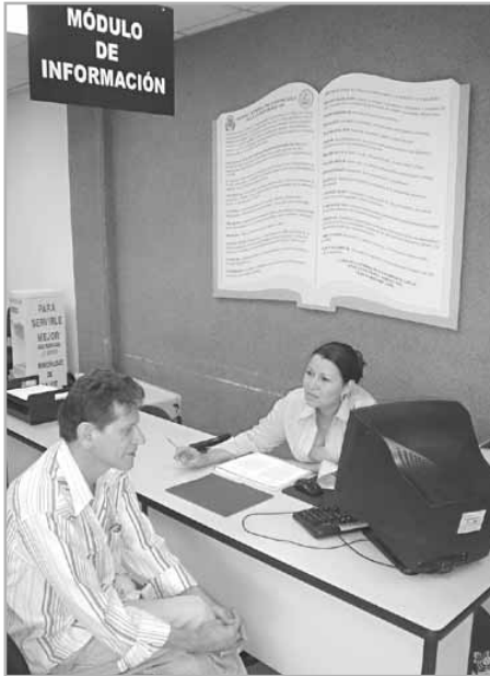
La Carta de la Tierra del gobierno local de la ciudad de San José

instruyeron en asuntos del desarrollo sostenible, el significado de los principios de la Carta de la Tierra y su aplicación en instituciones públicas. Un análisis comparativo de las políticas municipales frente a los valores y principios de la Carta de la Tierra demostró importantes lagunas entre ambos. La naturaleza democrática del proyecto permitió que los trabajadores se involucraran, no solo para interiorizar los valores de la Carta de la Tierra a nivel personal, sino también para incorporarlos al proceso de planificación estratégica de la Municipalidad.