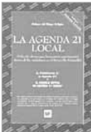
Portada del manual de la Agenda 21 Local desarrollado por DEYNA

La Agenda 21 habla de la pobreza, el consumismo excesivo, la salud, la educación, las ciudades y las agriculturas, entre otros tópicos. Enlaza todos los sectores de la sociedad en la