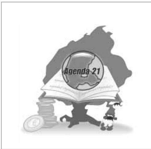
Mascota de la Agenda 21 en España

La Agenda 21 local (LA21) es el proceso de diseñar e implementar planes locales de desarrollo sostenible. Fue descrita en Agenda 21 – el plano global para la sostenibilidad que se acordó en la Conferencia de las Naciones Unidas sobre Medioambiente y Desarrollo en 1992, en Río, Brasil. El Capítulo 28 de la Agenda 21 identifica las autoridades locales como la esfera de gobierno más cercana a la gente, y hace un llamamiento a las mismas para que consulten con sus comunidades y desarrollen e implementen un plan local para la sostenibilidad – una “Agenda 21 Local”.