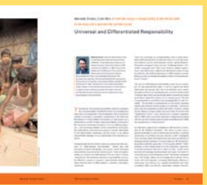
Este libro está colmado de palabras, fotografías y muestras de arte provenientes de todo el mundo y que son fuente de inspiración.