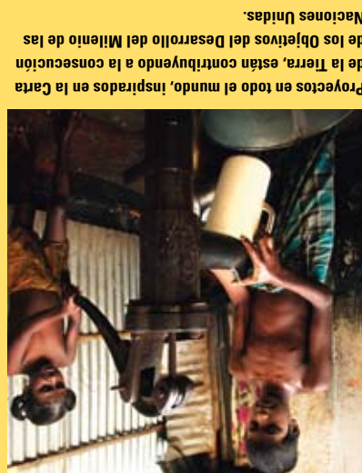
Proyectos en todo el mundo, inspirados en la Carta de la Tierra, están contribuyendo a la consecución de los Objetivos del Desarrollo del Milenio de las Naciones Unidas.

La Comisión de la Carta de la Tierra supervisó el proceso internacional de consulta y de redacción, y estableció un consenso en torno al texto final de la Carta.