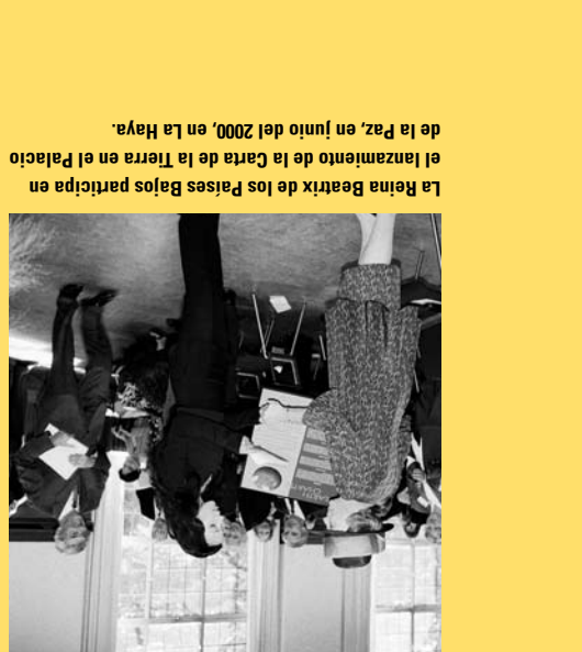
La Reina Beatrix de los Países Bajos participa en el lanzamiento de la Carta de la Tierra en el Palacio de la Paz, en junio del 2000, en La Haya.