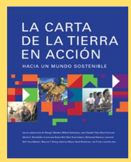
Portada, La Carta de la Tierra en Acción.

o contáctenos a Secretaría Internacional de la Carta de la Tierra y Centro Carta de la Tierra de Educación para el Desarrollo Sostenible en UPAZ C/o Universidad para la Paz Apartado Postal 138-6100 San José, Costa Rica Tel. (506) 2205 9000 Fax: (506) 2249 1929 Correo electrónico: info@earthcharter.org