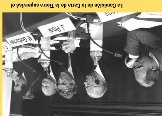
La Reina Beatrix de los Países Bajos participa en el lanzamiento de la Carta de la Tierra en el Palacio de la Paz, en junio del 2000, en La Haya.

La Comisión de la Carta de la Tierra supervisó el proceso internacional de consulta y de redacción, y estableció un consenso en torno al texto final de la Carta.