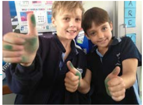
Pulgares verdes en OLR Kenmore

El objetivo del programa es educar, informar y capacitar a los estudiantes para conectarlos con el mundo que les rodea y actuar respecto a una serie de cuestiones ambientales en sus comunidades locales y más allá. A los estudiantes que hacen un esfuerzo significativo para crear un mundo pacífico, justo y sostenible, se les reconocen sus logros en la ceremonia anual de Premios Héroe de la Vía Verde, en noviembre de cada año.