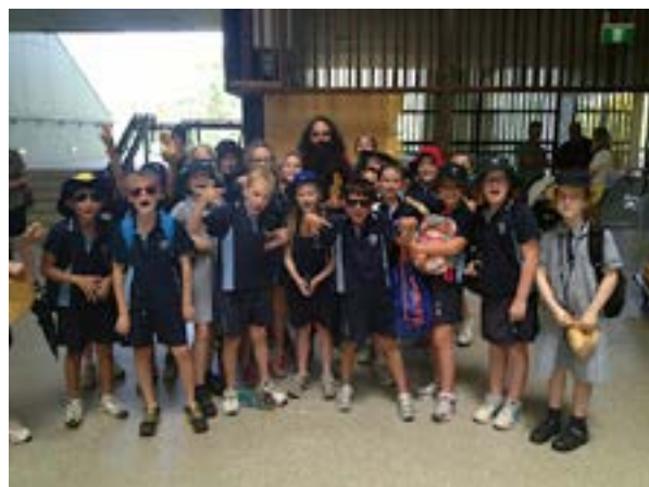
Ganadores OLR del Diario Green Lane de OLR Kenmore

El problema de un currículo sobrecargado ha supuesto un problema desde hace mucho tiempo para los educadores ambientales, quienes han trabajado sin descanso para incluir la sostenibilidad dentro del currículo. El Diario Vía Verde representa un añadido más que ha servido al sector educativo para incorporar la sostenibilidad, porque consigue armonizar simultáneamente con los marcos del currículo existente y al mismo tiempo proporciona oportunidades para un aprendizaje experimental y transformador. Este es un logro significativo si se tiene en cuenta que el Diario Vía Verde no está gestionado por un organismo de gobierno, sino enteramente coordinado y distribuido por una organización sin fines de lucro. Con el tiempo, el Diario Vía Verde ha dado lugar a una red de educadores, cuyas conexiones han logrado el desarrollo de un conjunto de casos de buenas prácticas en el campo de la educación para el desarrollo sostenible. Gracias a este enfoque práctico, innovador y colaborativo, el programa Diario Vía Verde ha propiciado un sentimiento de confianza en muchos educadores que de lo contrario se habrían quedado al margen de ESD. En esencia, el programa ha apoyado a los educadores en la transformación de los valores de la Carta de la Tierra en acciones, animando a los estudiantes a aprender cómo desarrollar soluciones sostenibles a cuestiones medioambientales.