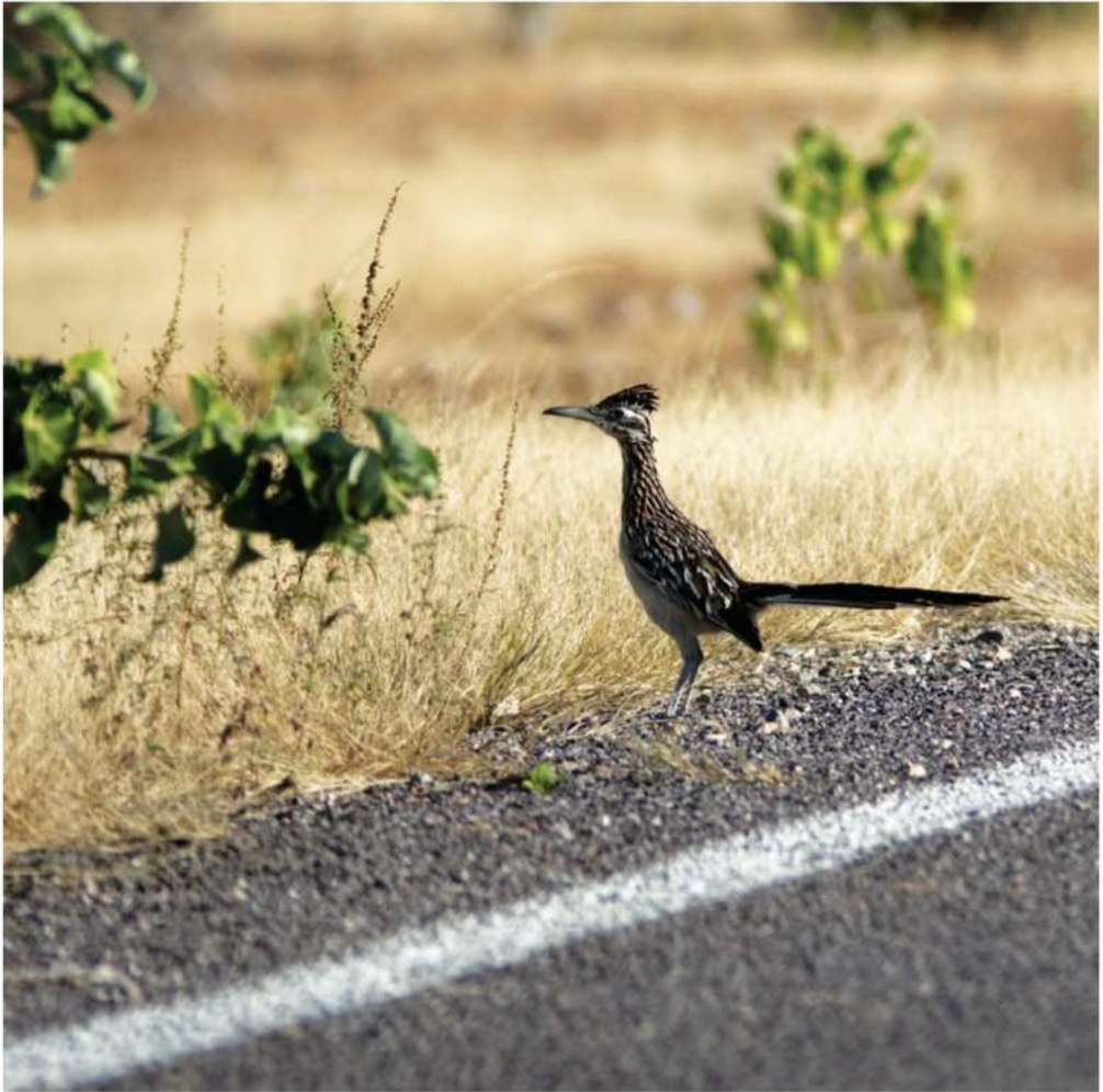
Corredor Norteño ( Geococcyx californianus ), fotografía de Manuel Grosselet, cortesía de CONABIO

jamasuse nu habu 'bui n'e da t'embi ge ri 'ñepi da jamasu ha ga'tho ngu t'uki n'e ndängi ngu ga ndä habu xa ts'a da thopi da nja xi xa hño.