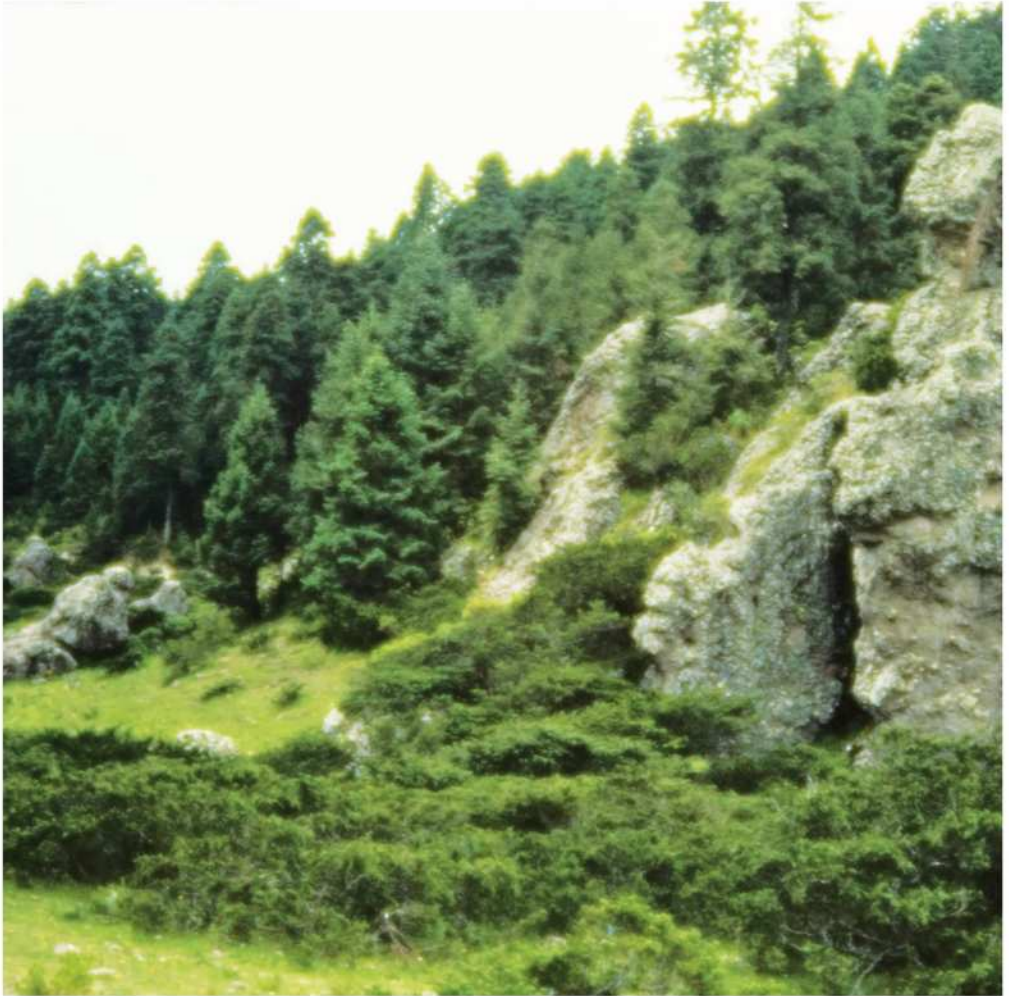
Bosque templado (Pachuca, Hidalgo), fotografía de Jerzy Rzedowski Rotter, cortesía de CONABIO

tepostlamachtlistli, ika nemilis tlen kenekiki kachi paleuilstli itech in altepeme tlen moskaltitikati.